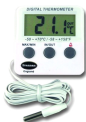
Termómetro digital para refrigeração ou congelação

Amplitude: -49.9^{\circ}\text{C} a +69.9^{\circ}\text{C} Embalagem: 1 Unidade Ref: 22-420-3