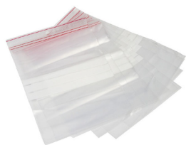
Sacos esterilizados Fecho Zip