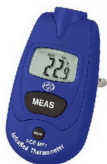
Termómetro Infravermelho Digital

Amplitude: -49.9^{\circ}\text{C} a +69.9^{\circ}\text{C} Embalagem: 1 Unidade Ref: 22-420-3