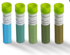
Testes avaliação quantidade de óleo na fritura