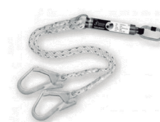
Cabo Y com amortecedor