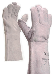
Luvas Proteção específica

SOLDADOR Embalagem: 1 par Ref: LUV35CR5CAV10