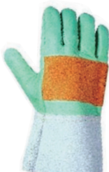
Luvas Proteção específica

SOLDADOR Embalagem: 1 par Ref: LUV35CR5CAV10