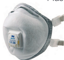
Máscara respiratória soldadura