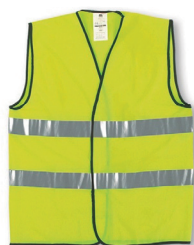
Colete de Alta Visibilidade