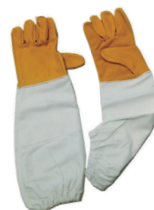
Luvas Proteção específica

LENHADOR Embalagem: 1 par Ref: LUVCHASTO