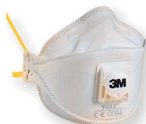
Máscara respiratória descartável