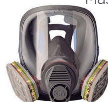
Máscara respiratória panorâmica